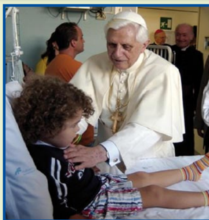
Su Santidad el Papa visitando a niños enfermos en un hospital romano.

paz de contribuir mediante la compasión a que el sufrimiento sea compartido y sobrellevado también interiormente, es una sociedad cruel e inhumana» (Encíclica Spe Salvi, 38). Citando a S. Bernardo, dice: «Dios no puede padecer, pero puede compadecer». Por eso, el Dios encarnado, Dios de amor, manifestado en Jesucristo, expresa y se difunde por la consolación del amor, por el compadecerse del hombre sufriente». El agente de salud prolonga esa compasión a los enfermos que visita.