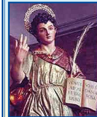
San Pancraticus, mártir, según la tradición, murió

La misa en su forma «extraordinaria» —regulada por disposición de S.S. Benedicto XVI— ha venido celebrándose, desde hace tres años, en la parroquia sevillana de San Bernardo. Ahora, con la conformidad del Arzobispo, queda trasladada a la iglesia del monasterio de la Visitación, de religiosas Salesas (plaza de las Mercedarias), donde se celebrará todos los domingos y días de precepto a las 10,30 horas. El acompañamiento musical de la celebración estará a cargo de la Schola Iubilante Deo , que ha sido constituida ex profeso con esa finalidad y que interpretará composiciones gregorianas.