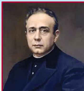
San Pedro Poveda, fundador de las Teresianas.

En una carta, al convocar el centenario e iniciar los