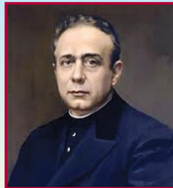
San Pedro Poveda, fundador de las Teresianas.

En una carta, al convocar el centenario e iniciar los