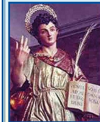
San Pancraccio, mártir, según la tradición, murió

La misa en su forma «extraordinaria» —regulada por disposición de S.S. Benedicto XVI— ha venido celebrándose, desde hace tres años, en la parroquia sevillana de San Bernardo. Ahora, con la conformidad del Arzobispo, queda trasladada a la iglesia del monasterio de la Visitación, de religiosas Salesas (plaza de las Mercedarias), donde se celebrará todos los domingos y días de precepto a las 10,30 horas. El acompañamiento musical de la celebración estará a cargo de la Schola Iubilante Deo , que ha sido constituida ex profeso con esa finalidad y que interpretará composiciones gregorianas.