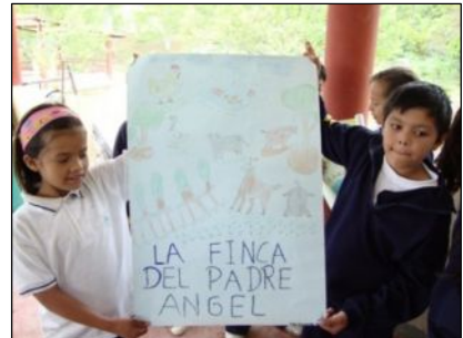
LA FINCA DEL PADRE ANGEL