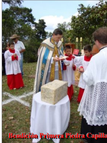
Bendición Primera Piedra Capilla