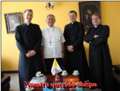
Nuestro querido obispo