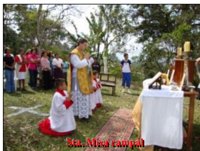
Sta. Misa campal